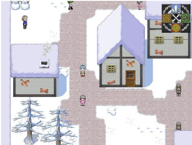
氷雪の街『セレストゥルク』