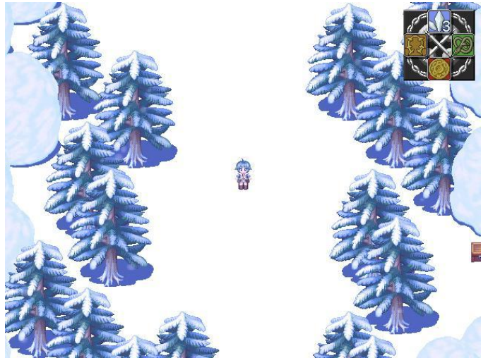
冷のダンジョン『樹氷の森』